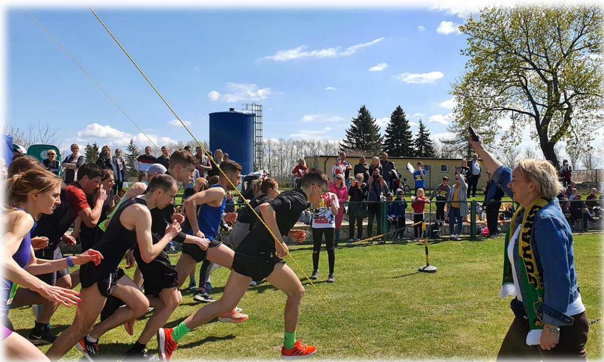
Bieg Bartów (30.04.2022 r.)