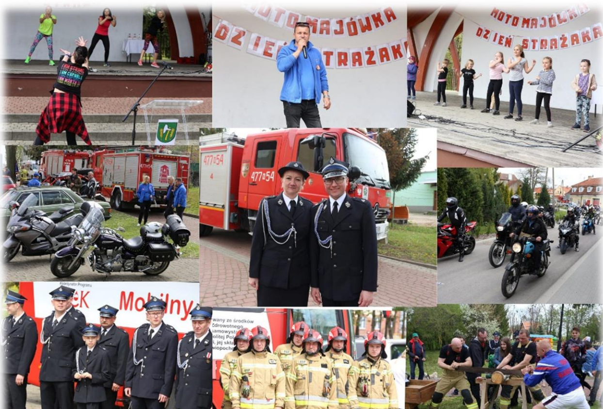
Barciańska Motomajówka (7 maja 2022 r.)