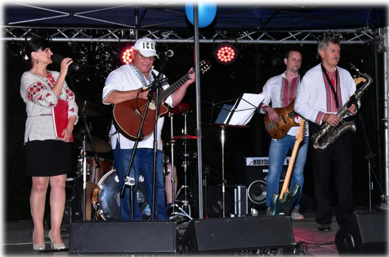
Asuniada (27.08.2022 r.)