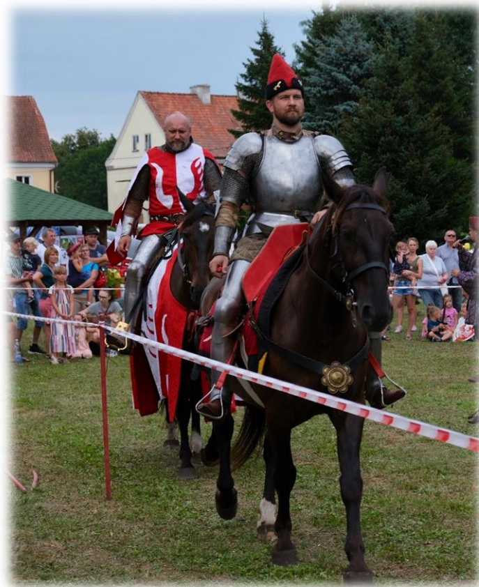
Bitwa o Strażnicę (20.08.2022 r)