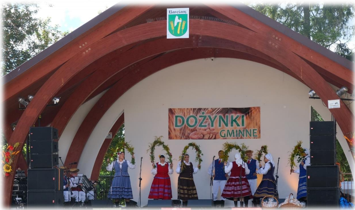
Dożynki Gminne (03.09.2022 r.)