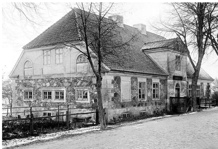
www.Bildarchiv-Ostpreussen.de 009334 / W4

Budynek przedstawiony na fotografii poniżej powstał w 1833 roku, zbudowany został z kamienia i podpiwniczony na całej długości. W roku 1900 powstał w nim dom starców pod nazwą „Ludwigsbau”, który został ufundowany przez Grafa von Schwerina. Budynek dzielił się na 4 części, w każdej z nich były 2 pomieszczenia. Środek natomiast wydzielony był dla pielęgniarek.