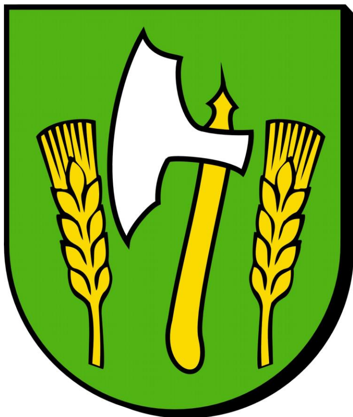
Flaga Gminy Barciany