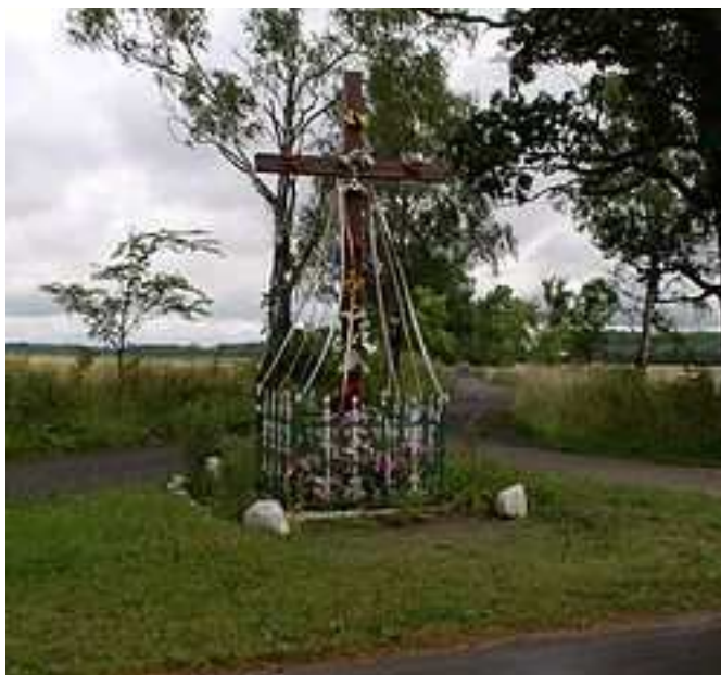
Teren wokół krzyża ( skrzyżowanie dróg)