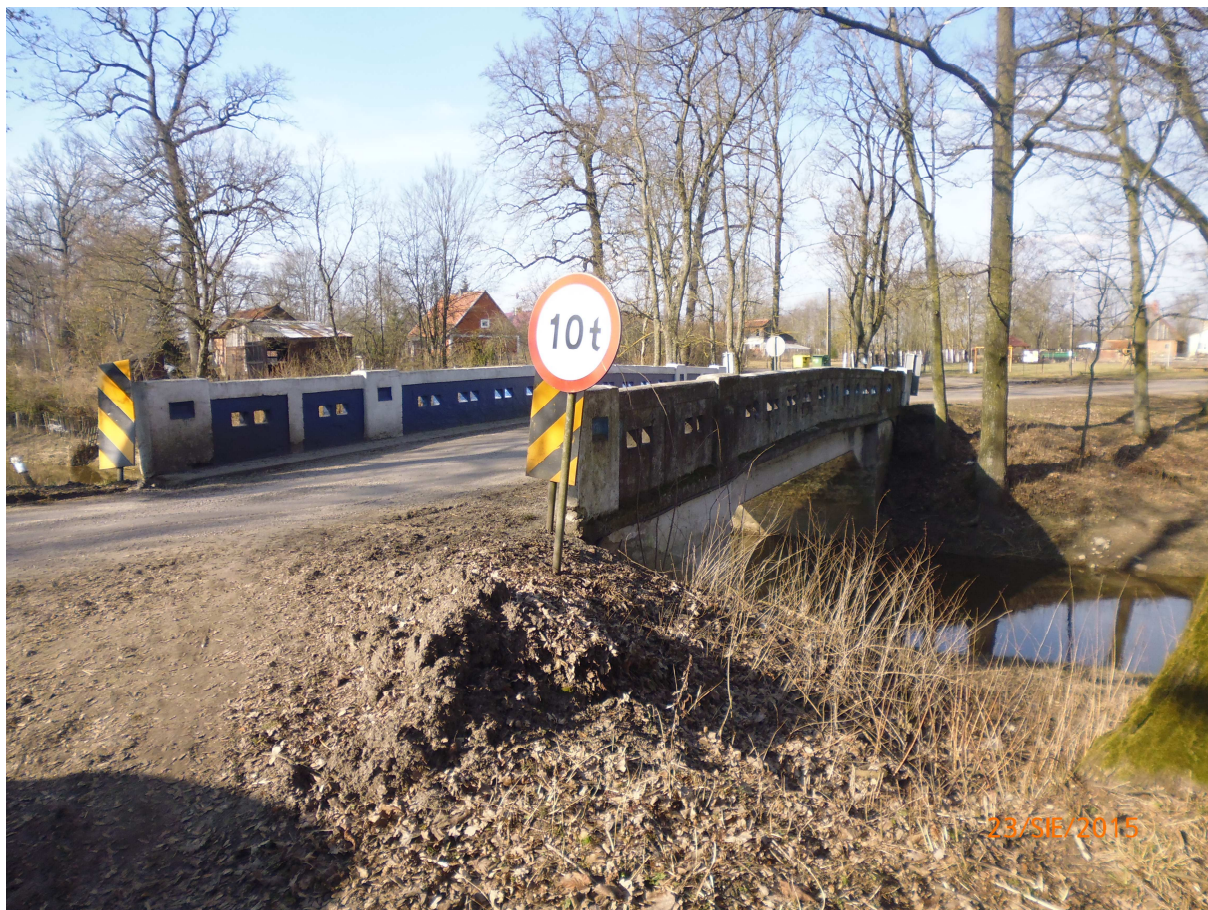
Przebudowa mostu na drodze Nr 1398N