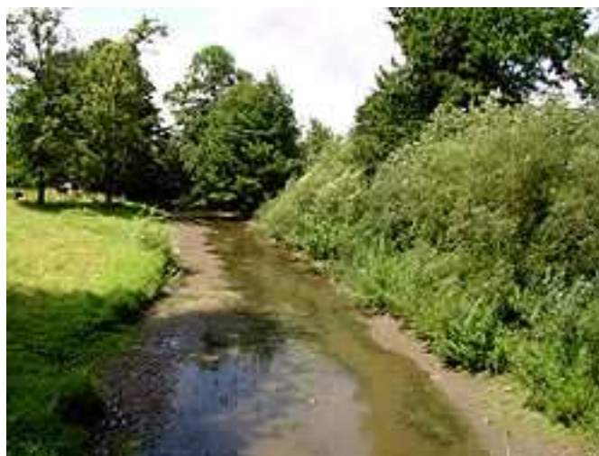
Miejsce na nowy most