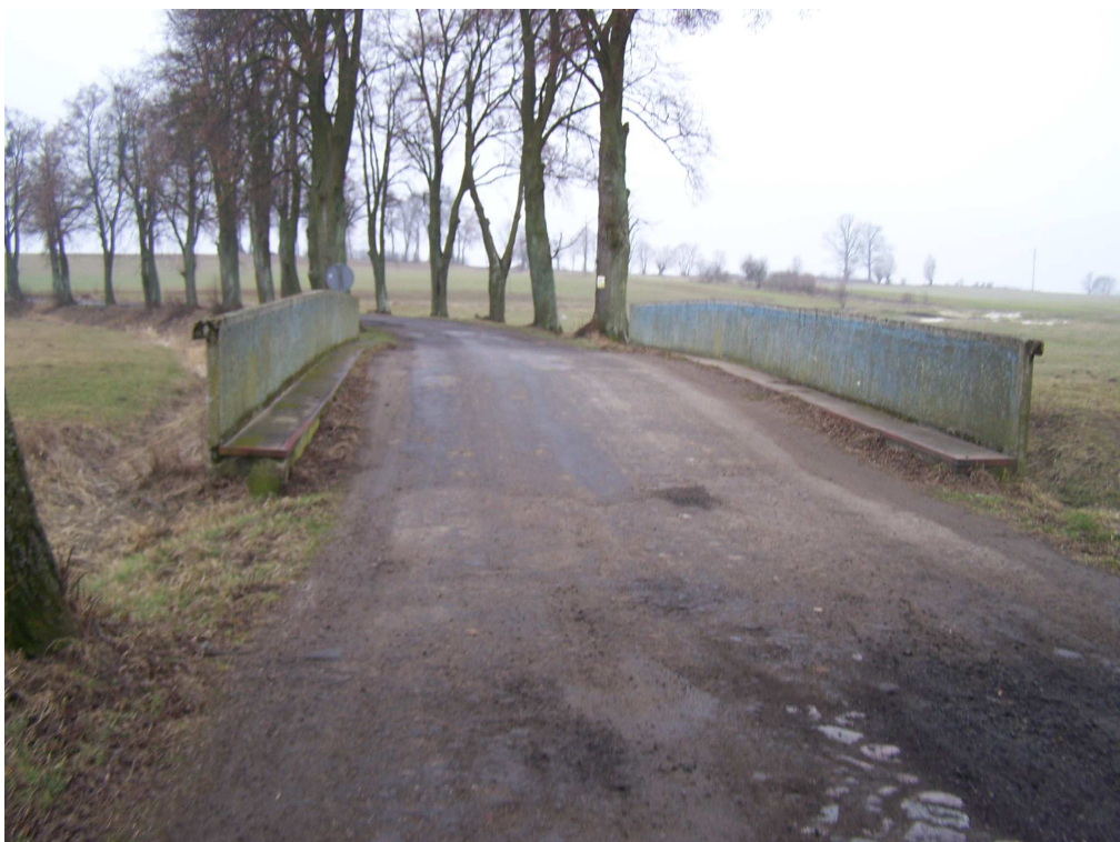
Droga powiatowa Nr 1703N wraz z mostem