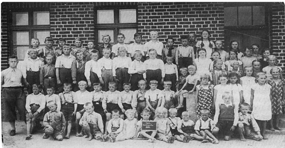
www.Bildarchiv-Ostpreussen.de 011439 / S1 Sausgörken, Kreis Rastenburg, MT17094-0. Schule. (1934), ©