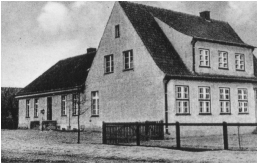
011438 / S1-1b Sausgörken, Kreis Rastenburg, MT17094-0. Schule. (1936-1940)