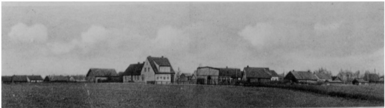
011457 / St1 Sausgörken, Kreis Rastenburg, MT17094-0. Dorfansicht. (1930-1935)